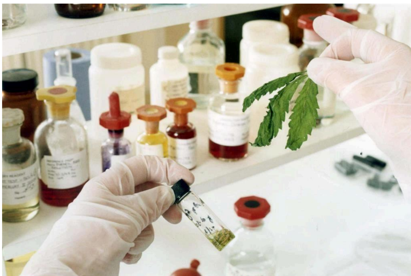
Prodotti a base di cannabis

Il decreto del ministero della Salute inserisce il cannabidiolo nella tabella B dei medicinali dopo i pareri dell'Iss e del Css. La protesta degli imprenditori della canapa