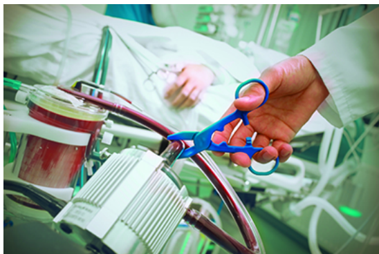
Doctor harms a patient with cutting tube in the hospital

Preoccupa la raccolta di firme per la cosiddetta «eutanasia legale»