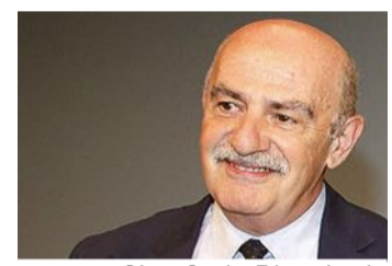
Gian Carlo Blangiardo

mente, negli ultimi sei anni, oltre un milione di unità. Ma l'auspicata svolta per arginare la corrente impetuosa del declino demografico richiede un'efficace e tempestivo intervento sul terreno delle nascite: necessita l'avvio di un piano mirato ad indirizzare in tempi brevi il livello di fecondità degli italiani, oggi precipitato a 1,2 figli