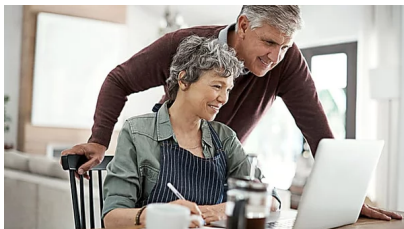
Italiani più attenti alla salute, 2 su 3 s'informano sul web