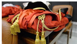
Uccisa e in pasto ai maiali, c'è svolta - Cronaca