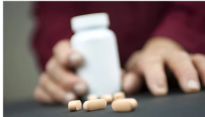
Artrite e diabete si curano insieme, arriva 'terapie per due'