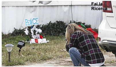
Bimbe chiuse in macchina 18 ore, morte - Mondo