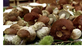
Malore mentre cercano funghi, due morti