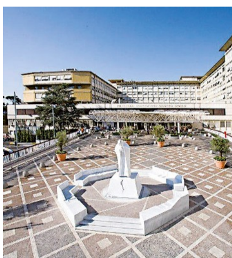
L'esterno del Policlinico Gemelli

Dieci milioni di prestazioni, 94mila dimissioni, 50mila casi di neoplasie all'anno curate fanno dell'ospedale romano il secondo in Italia per dimensione e trattamenti