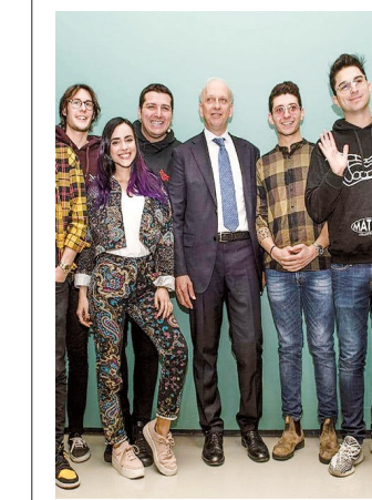
Il ministro Bussetti ieri con youtuber e influencer