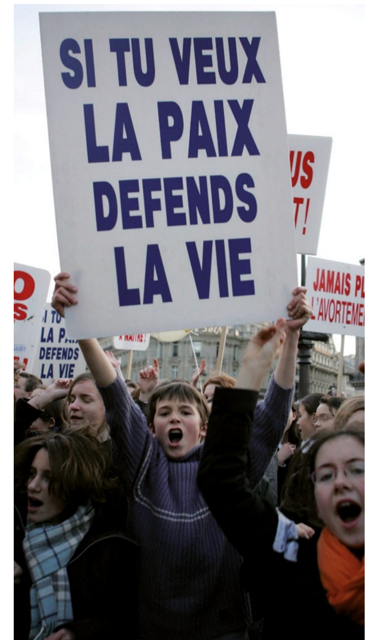
IN MARCIA. Una manifestazione per la vita a Parigi

Lettera dell'arcivescovo di Marsiglia a Hollande: «Certi nostri cittadini, riuniti in associazioni, hanno solo deciso di offrire del tempo, attraverso degli strumenti digitali, all'ascolto di donne esitanti o in situazione di difficoltà rispetto alla possibile scelta»