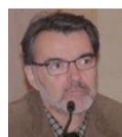
di Luciano Moia

Nel cuore della grande emergenza educativa c'è un problema ancora più vasto e profondo, che la comprende e la ingloba. E che, neppure tanto paradossalmente, ne sarebbe la soluzione radicale. Perché se si vuole davvero invertire il disagio educativo che inquina tanti rapporti pubblici e privati e determina situazioni acute di malessere sociale, non c'è che una strada. Quella di ridare fiato a un'idea di matrimonio come motore pulsante della famiglia, architrave della società, grammatica di virtù che si irradia dalla realtà domestica e diventano patrimonio civile. L'equazione che dovremmo riproporre con forza, non si presta a equivoci. Ha l'immediatezza di uno slogan e la forza della verità: più matrimonio, più famiglia, più benessere sociale. Quanto più i giovani - e meno giovani - vengono aiutati a comprendere che il matrimonio è la via preferenziale per il raggiungimento della massima felicità possibile, quanto più le famiglie vengono poste nelle condizioni migliori per svolgere al meglio i propri compiti, tanto più si costruisce un futuro migliore per tutti, con comunità più vivibili perché più accoglienti, sorridenti e solidali. Non si tratta di un'utopia, perché laddove, come in alcune aree del Trentino, si è avuto il coraggio di costruire una società quanto più "family friendly" possibile, si è visto un aumento della natalità e un rallentamento della conflittualità familiare. Ma non solo, sostenere le reti