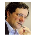
di Leonardo Becchetti