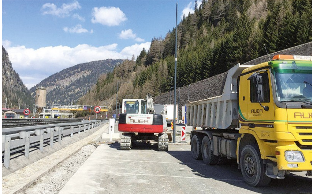
I lavori per creare una barriera alla frontiera al Brennero avviati dall'Austria