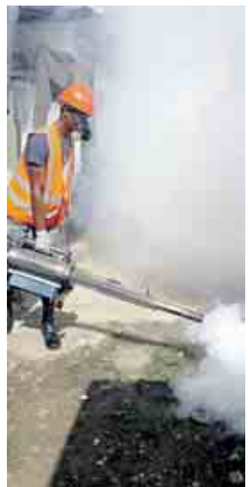
Bonifica in Sud America

cali, utilizzando per la prima volta il fondo per le emergenze istituito dopo l'epidemia di Ebola, consisterà nella distribuzione di materiale protettivo e counseling alle donne in gravidanza, a una stretta sorveglianza nei paesi colpiti anche per verificare l'effettivo legame tra virus e microcefalia, e a un impulso alla ricerca per trovare un test rapido e, in un secondo momento, un vacci-