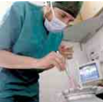
La ricerca con 20-30 embrioni