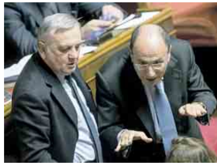
Maurizio Sacconi e Renato Schifani

DEM RICOMPATTATI BERSANI PERÒ IRONIZZA «DENIS? UN VOTO DI COSCIENZA...» ALA INDISPENSABILE PER ARRIVARE A 161