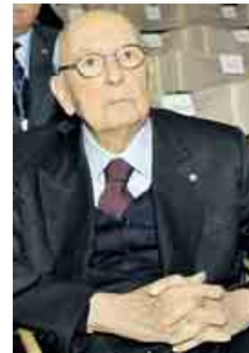
Giorgio Napolitano

Lo spiegano sia alcuni cattodem informati, sia altri che cattolici non sono. E il motivo si chiama Giorgio Napolitano. «Sì, l'ex presidente è molto preoccupato, ha avanzato dubbi sulla stessa costituzionalità del ddl, e dal punto di vista politico non accetta e non vede bene questa spaccatura verticale nel Paese tra laici e cattolici», spiegano quanti hanno parlato con l'ex presidente o sono venuti a conoscenza dei suoi dubbi. «Per noi Napolitano è il nostro Ruini», sottolinea Emma Fattorini, la cattodem in prima fila nella ricerca di una soluzione