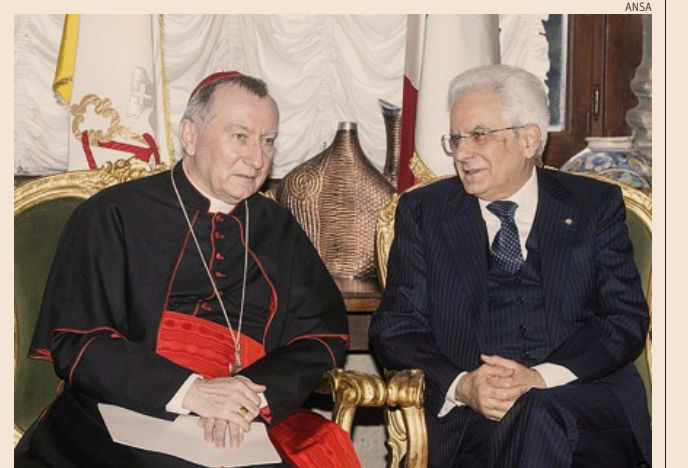
Anniversario dei Patti Lateranensi. Il cardinale Pietro Parolin con il capo dello Stato Sergio Mattarella