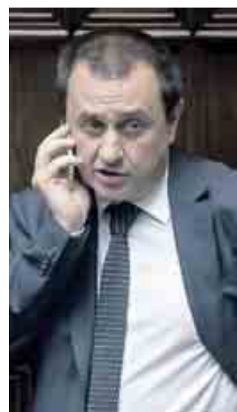
Ettore Rosato, presidente del gruppo del Partito democratico a Montecitorio

«Quella di Alfano è una mossa politica. Non mi sembra il modo giusto di approcciarsi a questa discussione. Qui è in gioco un punto delicatissimo come quello della tutela dei minori e si tratta di un punto che non dovrebbe essere usato per questi giochi. D'altra parte non posso dimenticare che buona parte dell'opposizione ha avuto un atteggiamento ostruzionistico finora e, di fatto, ha impedito di discutere nel merito».