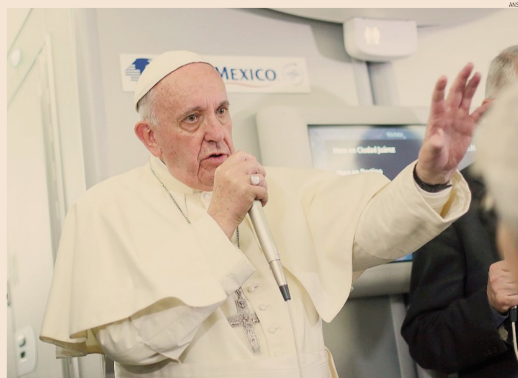
La conferenza stampa. Papa Francesco parla con i giornalisti nel volo per Roma di ritorno dal Messico