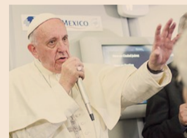
Il Papa Sull'aereo dal Messico risponde ai giornalisti

Il volo da Ciudad Juarez a Roma chiude il viaggio in Messico. Ma Francesco, nella conferenza stampa che tiene al termine di ogni missione, apre altri "fronti", come il giudizio sulle posizioni espresse dal magnate Usa e candidato repubblicano Donald Trump («fare muri non è cristiano»). E, sulle vicende italiane, chiarisce qual'è la sua posizione sulle unioni civili: «Non mi immischio, si voti secondo coscienza».