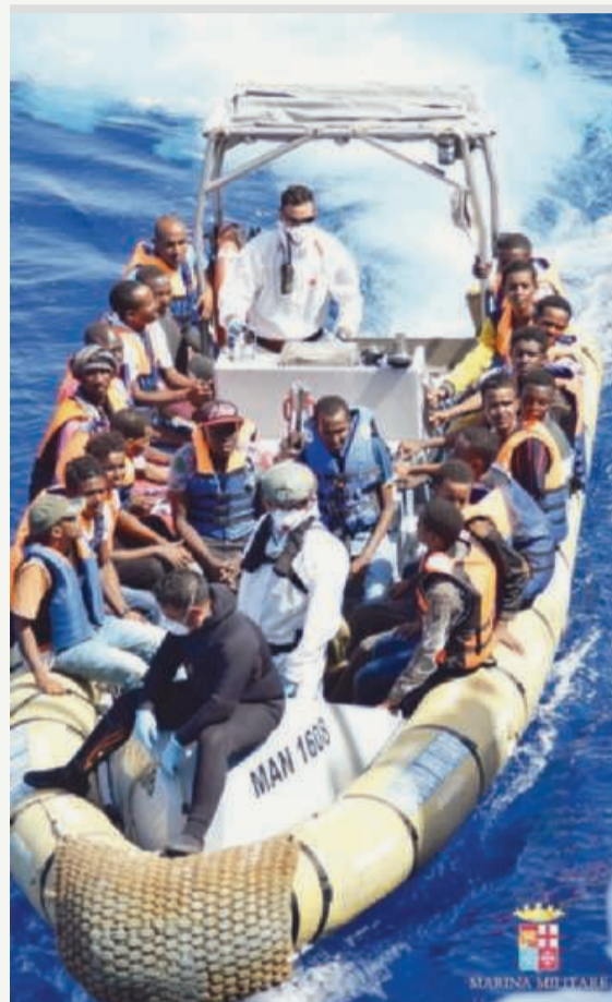
Migranti soccorsi dalla Marina Militare.

Pertanto, allo stato attuale della legislazione, sebbene l'ingresso e il soggiorno irregolare in Italia (art.