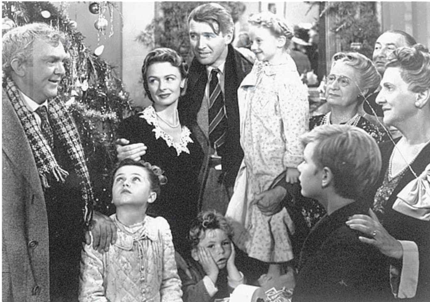
Happy end La scena finale di «La vita è meravigliosa» film di Frank Capra dove il protagonista ritrova la pace con se stesso in occasione del Natale

Dai pranzi ai regali, dall'incontro con i parenti a viaggi e luminarie. L'importanza di riti e gesti strutturati (al di là delle credenze religiose)