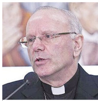
Il vescovo Nunzio Galantino

«Nessun'altra forma di convivenza, pur rispettabile, può indebolire la centralità del nucleo familiare, né sul piano sociologico né sul piano educativo»