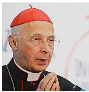
Il cardinale Angelo Bagnasco

L'equiparazione alle nozze? Inopportuna e inutile. La stepchild adoption ? Inammissibile. È tutta l'impostazione da capovolgere: da un'attenzione concentrata su piccoli gruppi alla volontà di rispondere alle esigenze dei milioni di famiglie che costruiscono e sostengono il Paese.