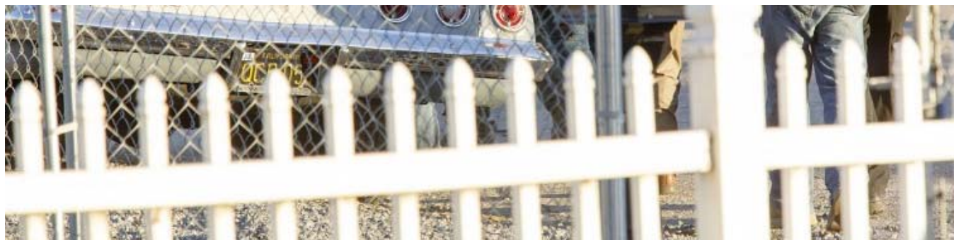
La polizia mentre controlla case di sospetti a caccia degli esecutori dell'assassinio a San Bernardino, California

Solo il tempo e le indagini ci diranno se la strage perpetrata a San Bernardino, in California, è opera di un gruppo di terroristi o la vendetta di un dipendente insoddisfatto, quel che è certo è che la furia delle armi si è rivolta verso chi non avrebbe mai potuto difendersi per ragioni oggettive: i disabili.