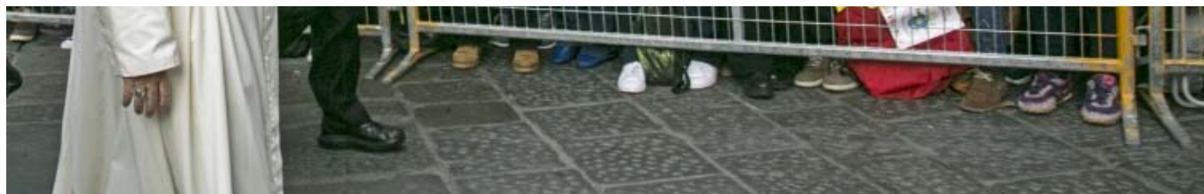
Firenze, 10 novembre 2015: l'arrivo di Papa Francesco - Foto: Siciliani-Gennari / SIR

Come si parla a “una Chiesa adulta, antichissima nella fede, solida nelle radici e ampia nei frutti”? Con rispetto e parresia, con semplicità e profondità, con amore e prossimità, con fedeltà e serenità, con severità caritatevole e slancio creativo, con la forza del dialogo e il trasporto di chi sa amare, senza imporre scelte ma suggerendo itinerari, senza giudicare ma lasciandosi valutare. E soprattutto lasciandosi svuotare... Svuotare dalle ambizioni e dalla ricerca di potere, dal desiderio di occupare lo spazio ecclesiale come quello civile, dalla voglia di preservare tutti i nostri piccoli e grandi spazi di controllo sugli altri, dall’abitudine a fare sempre le stesse cose e a non allontanarci dalla strada collaudata, dalle strutture che abbiamo costruito nel tempo e che rischiano di diventare la nostra ragione di vita. E infine svuotarsi di sé per abbassarsi sul volto del povero nel quale possiamo riconoscere ogni uomo e ogni donna che ha calpestato e calpesta questa terra. Senza “addomesticare la potenza del volto di Gesù” in cui ciascuno può riconoscere tutta l’umanità e da cui lasciarsi inquietare.