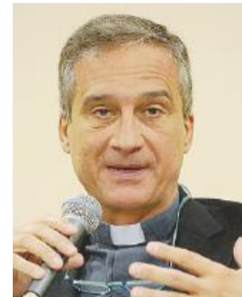
Monsignor Viganò

spiegato che "è anch'essa esposta anche alle malattie, al malfunzionamento, all'infermità". Successivamente è passato ad elencare le "malattie curiali": "Sono malattie e tentazioni che indeboliscono il nostro servizio al Signore". Una di esse è proprio "la malattia delle chiacchiere, delle mormorazioni e dei pettegolezzi. Di questa malattia ho già parlato tante volte, ma mai abbastanza. È una malattia grave, che inizia semplicemente, magari solo per fare due chiacchiere, e si impadronisce della persona facendola diventare "seminatrice di ziz-zania" (come satana), e in tanti casi "omicida a sangue freddo" della fama dei propri colleghi e confratelli. È la malattia delle persone vigliache che, non avendo il coraggio di parlare direttamente, parlano dietro le spalle". (...) In realtà, Bergoglio non è il primo Pontefice a e-