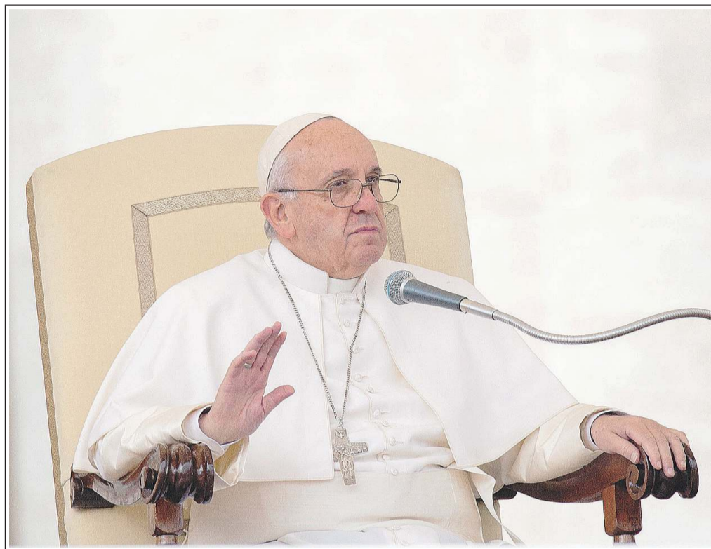
Papa Francesco, ieri durante l'udienza del mercoledì, ha chiesto che l'islam rispetti i diritti umani