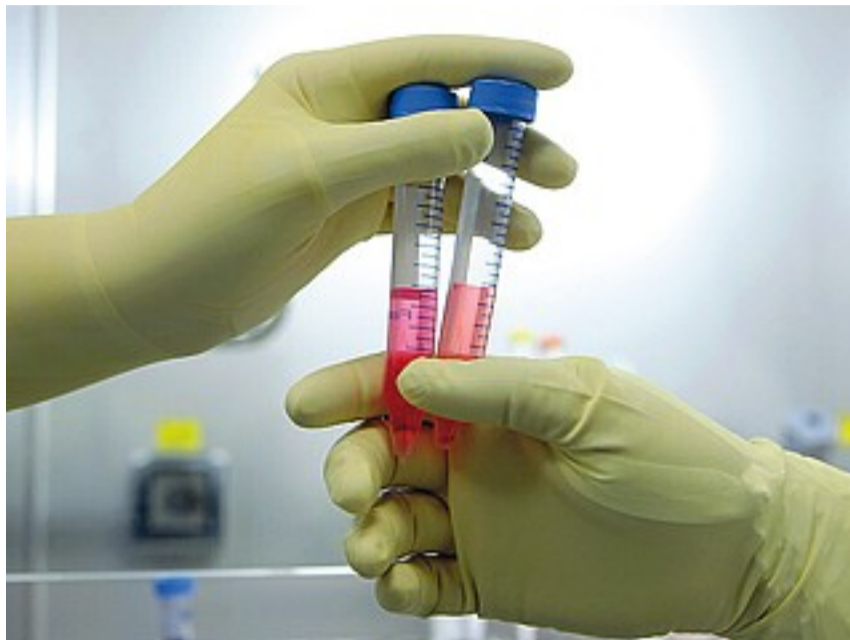
Siero Nella nostra regione, come nel resto d'Italia, sono in calo i bambini che vengono vaccinati

Di vaccinazioni si è discusso ieri in Assemblea regionale, mentre l'assessore era a Roma in vista della Conferenza delle Regioni di oggi. È infatti stata approvata con i voti di un'alleanza inedita formata da Pd, Sel