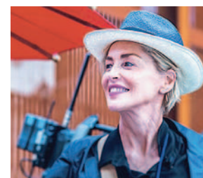
MADRINA Sharon Stone

«E' una grande sfida. Sono convinta che la vinceremo».