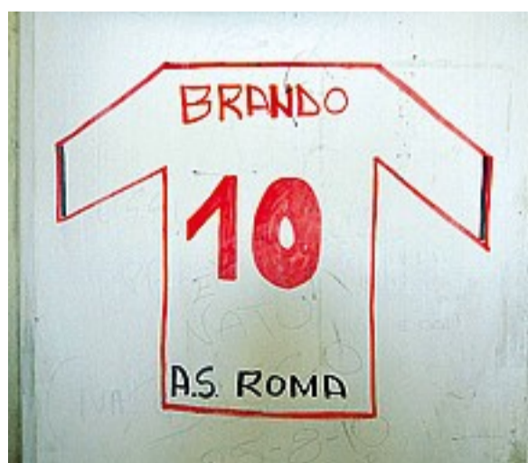
SERVIZIO FOTOGRAFICO JPEG

Ecco, è questo il pensiero che arriva qui davanti: si leggono i nomi di neonati appena arrivati nel mondo, e li si immagina un giorno che saranno proprio loro a venire di nuovo a scrivere qua. Chissà perché viene in mente questo. Forse è un pensiero che prova a tenere insieme il più possibile il mondo, a pensarlo con una larghezza visibile, che possiamo contenere e comprendere. Forse questo serpente infinito di testimonianze gratuite può fermare il tempo. O più probabilmente no, ma che importa.