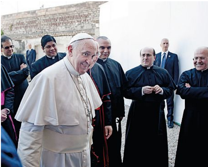
Papa Francesco Insieme ad alcuni sacerdoti e porporati A destra scene di giubilo dopo l'annuncio della vittoria del sì al referendum sui matrimoni gay in Irlanda