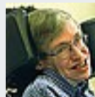
Stephen Hawking, 73 anni

«Se mi sentirò un peso, valuterò il suicidio»