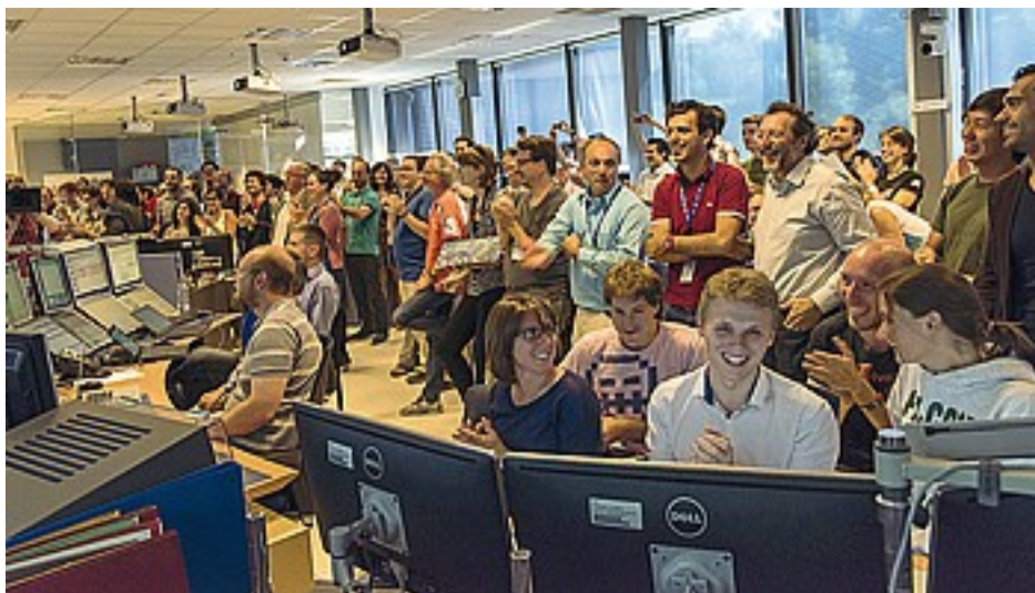
Al Cern Da sinistra, l'elaborazione grafica di tre momenti della collisione tra particelle a una velocità mai raggiunta in precedenza avvenuta nell'acceleratore del Cern di Ginevra. Nell'ultima immagine l'esultanza dei ricercatori e dello staff