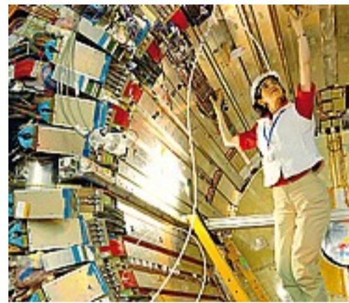
Fisica Fabiola Gianotti, 54 anni, direttore designato del Cern di Ginevra, lo guiderà dal primo gennaio 2016

Il fascino dei nuovi strumenti di indagine deriva anche dalla facoltà di portare dove nessuno aveva previsto.