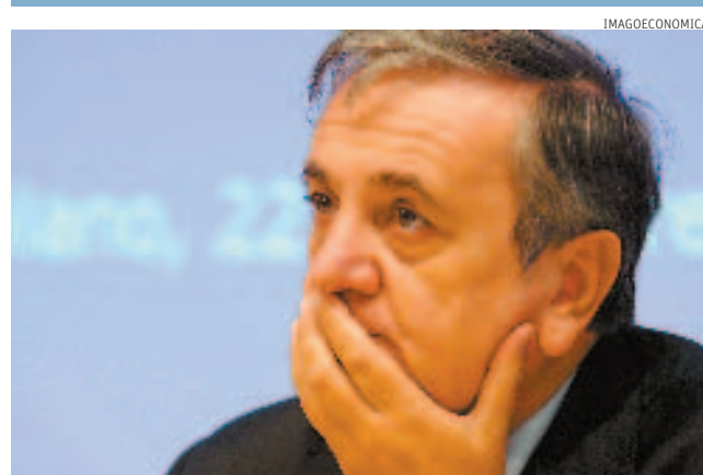
Dal ministro freno ai giudici. Il titolare del Welfare, Maurizio Sacconi

Ancora, il rapporto analizza l'impatto delle nuove norme e consuetudini in materia bancaria, assicurativa e dei servizi aerei, con obiettivi non sempre raggiunti e condivisi, e le prospettive di armonizzazione regolamentare in ambito europeo, prospettive in cui la centralità del consumatore ormai è un dato concettualmente acquisito ma non del tutto realizzato.