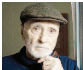
MARIO MONICELLI Malato di tumore, il 29 novembre 2010 il grande regista muore gettandosi dal balcone dell'ospedale romano in cui era ricoverato