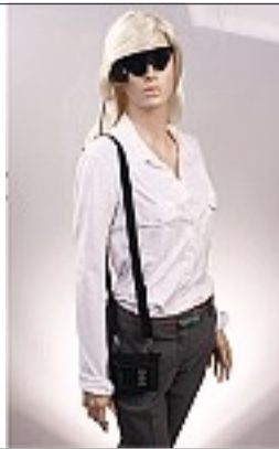
Corriere della Sera