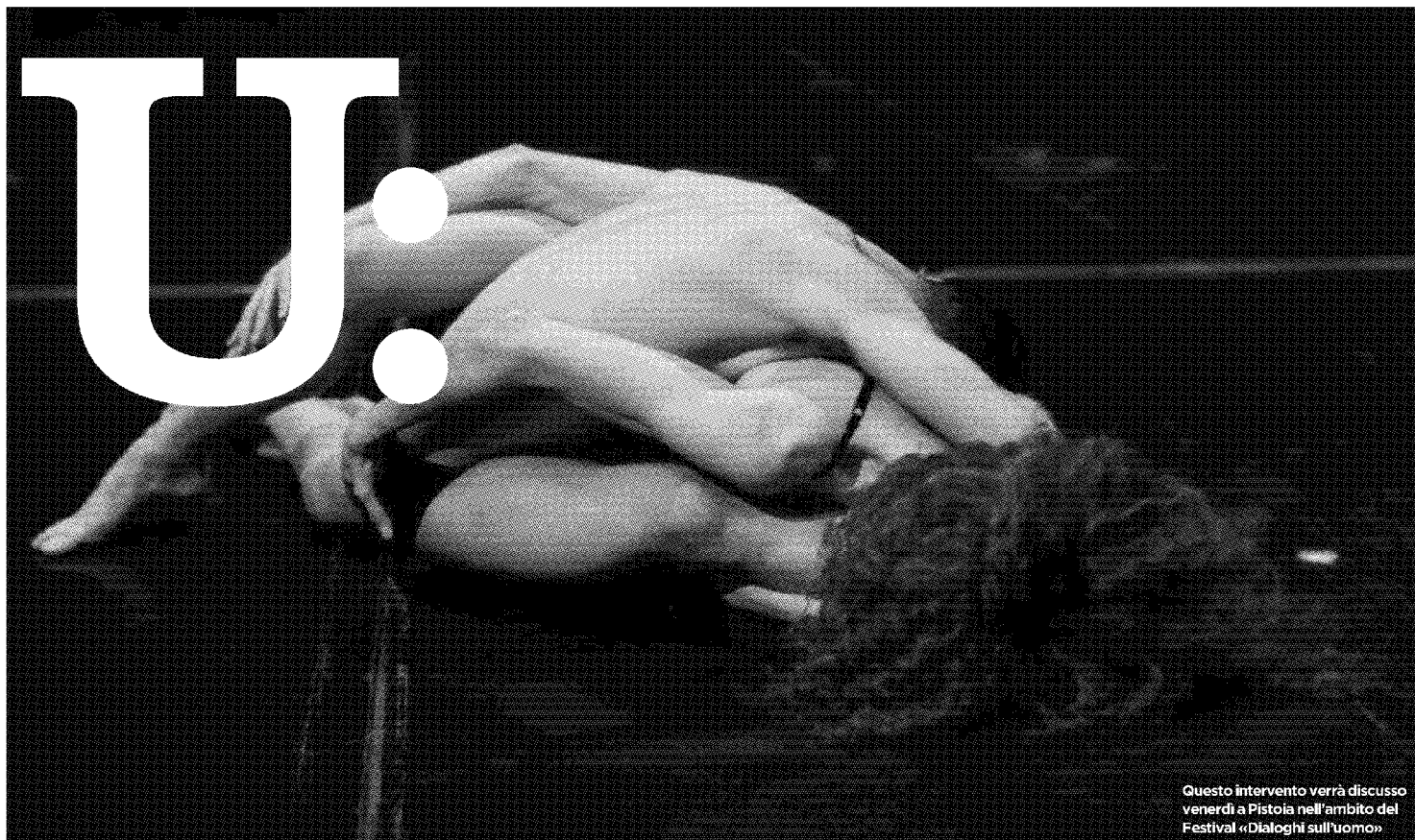
Questo intervento verrà discusso venerdì a Pistoia nell'ambito del Festival «Dialoghi sull'uomo»

Il perdono è dunque un dono, un dono di libertà, il dono del potere di ricominciare e insieme il tentativo di ricostruzione di una relazione interrotta in seguito a un'offesa. Come se si richiamasse in vita la possibilità di una libertà autenticamente umana, anche per chi ha sbagliato. È innegabile che si tratti di passaggi difficili tra agire, sentire e pensare, ma dotati di una grande forza etica: quella di assumersi il rischio, o meglio, di immaginare un futuro diverso da quello imposto dal passato.