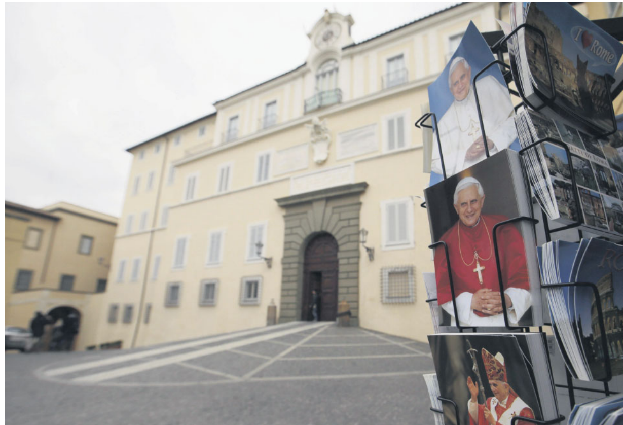
Immagini di Benedetto XVI davanti al palazzo di Castel Gandolfo, dove alloggerà dopo le dimissioni.

tempo di una discussione approfondita sui problemi della Chiesa e sulle possibili soluzioni prima di arrivare alla scelta del nuovo vescovo di Roma, successore di Pietro.