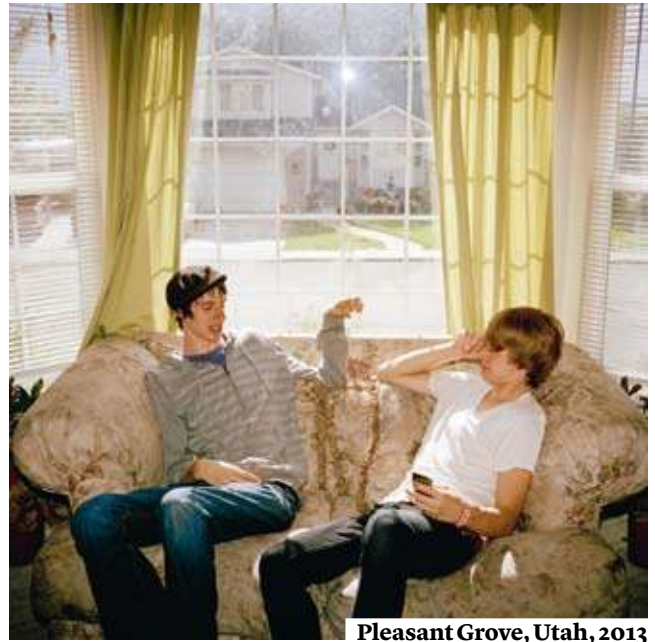
Pleasant Grove, Utah, 2013