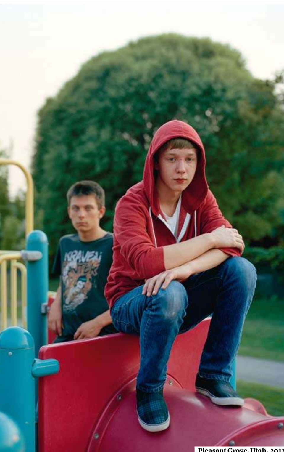
Pleasant Grove, Utah, 2012

hockey alle 5 del mattino, le nuove avventure della trigonometria (secante, cosecante, ma che è?) e le telefonate nel cuore della notte per farsi riportare a casa. E questo quando i figli sono bravi ragazzi.