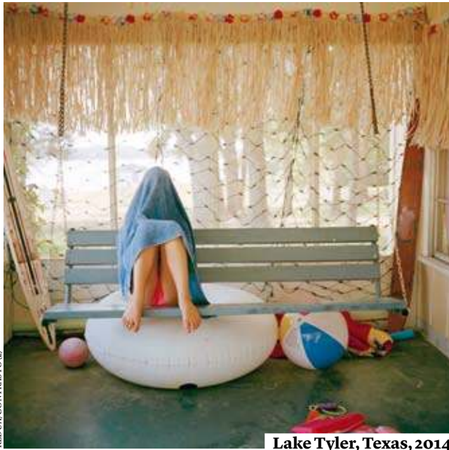
Lake Tyler, Texas, 2014