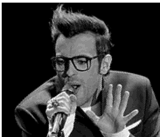
Cantante Marco Mengoni nato a Ronciglione (Vt) il 25 dicembre 1988, ha vinto X-Factor nel 2009. Attualmente è in tour nei teatri d'Italia