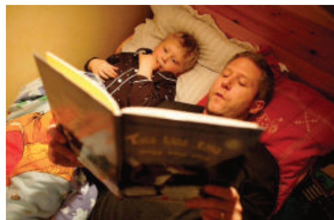
I padri che leggono fiabe aumentano in tutti i Paesi

I bambini ai quali il padre legge le storie della buonanotte sono più concentrati all'asilo, dispongono di un vocabolario più ampio e sanno contare con maggiore facilità. «Sviluppano una passione per le parole e per