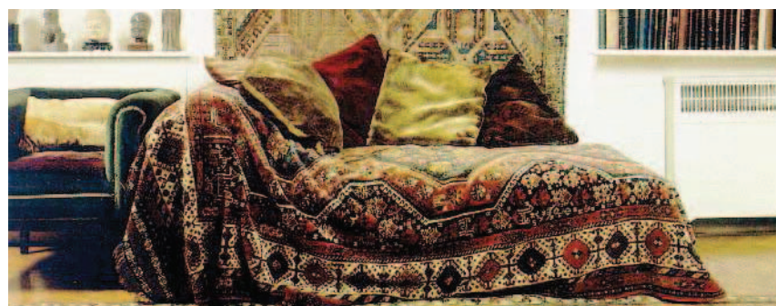
"Il divano di Freud cade a pezzi" La colletta del museo

que . I nemici francesi del manuale statunitense denunciano l'eccessiva semplificazione delle diagnosi, e quindi anche delle terapie. Anche negli Stati Uniti ci sono voci critiche. Lo psichiatra newyorchese Allen Frances ha contribuito alla precedente edizione del manuale per poi dissociarsi. Dopo la pubblicazione del Dsm-IV, nel 1994, sostiene infatti Frances, i casi di disturbi bipolari sono raddoppiati, mentre quelli di autismo sono stati moltiplicati per venti. In realtà, osserva lo psichiatra americano, non sono i casi ad aumentare ma le diagnosi, proprio a causa dell'ampiezza del sistema di catalogazione. Un altro "pentito" è il francese Boris Cyrulnik, che aveva partecipato alla terza edizione. Studioso del concetto di "resilienza", lo psichiatra ora sostiene: «Non possiamo pensare di curarci solo perché qualcosa nella nostra vita va storto».