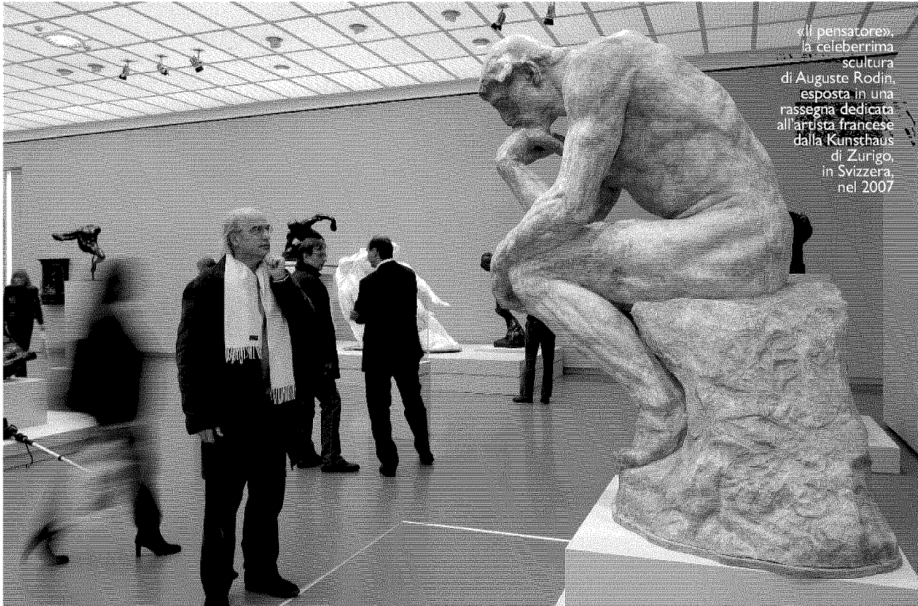
«Il pensatore», la celeberrima scultura di Auguste Rodin, esposta in una rassegna dedicata all'artista francese dalla Kunsthhaus di Zurigo, in Svizzera, nel 2007