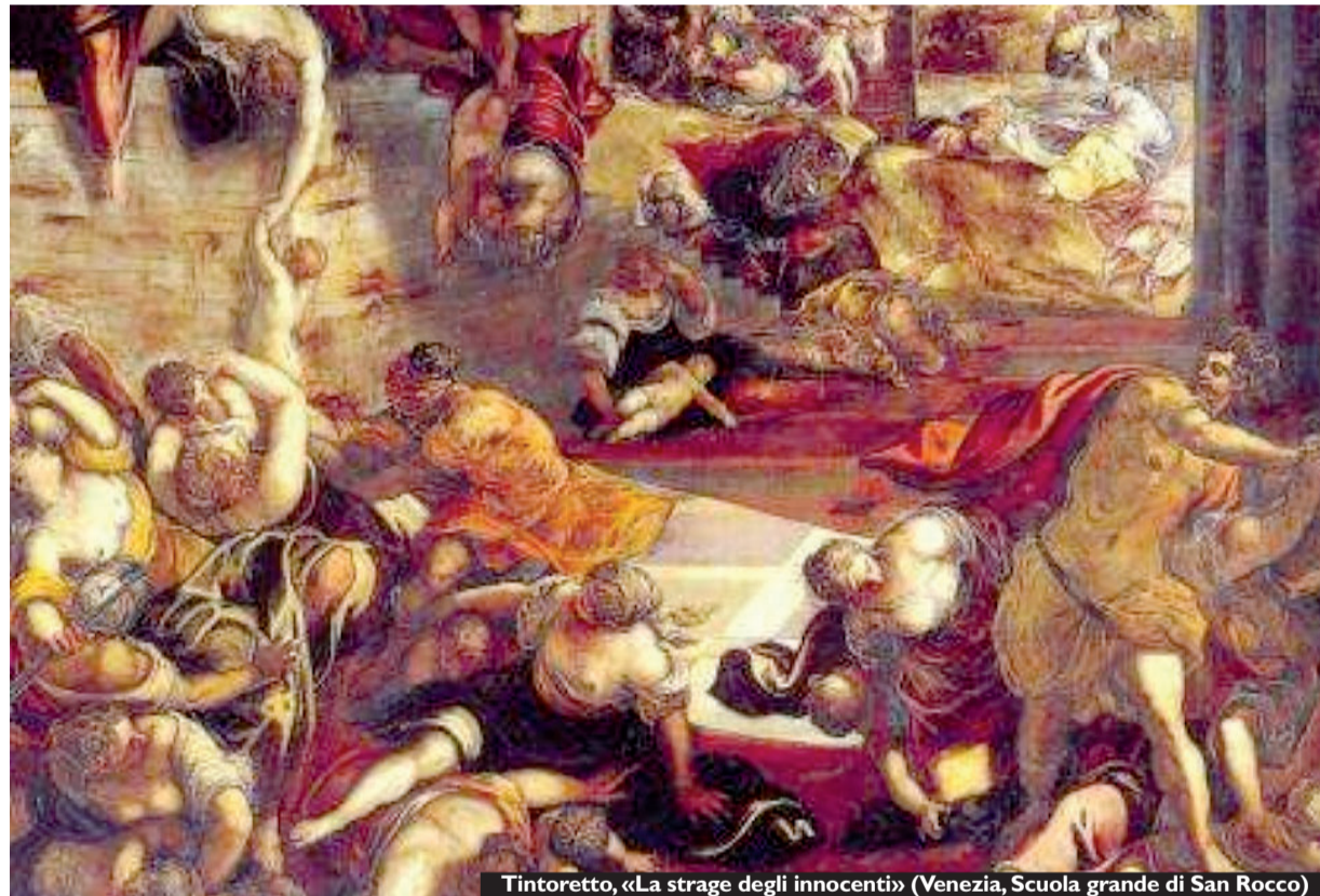
Tintoretto, «La strage degli innocenti» (Venezia, Scuola grande di San Rocco)

Quali siano allora queste caratteristiche che ci rendono persona è presto detto: «Non basta per esempio provare piacere o dolore, perché ciò avviene anche a un feto, serve uno sviluppo neurologico superiore, cioè avere degli scopi, delle aspettative verso il futuro, provare un interesse per la vita. E un neonato non li ha». Teorie che i due studiosi avevano già pubblicato nel 2012 sul Journal of Medical Ethics con un articolo dal titolo esplicito - "After birth abortion: why should the baby live?" -, scatenando polemiche a tutte le latitudini e, obiettivamente, trovando ben pochi estimatori anche nel mondo più laico.