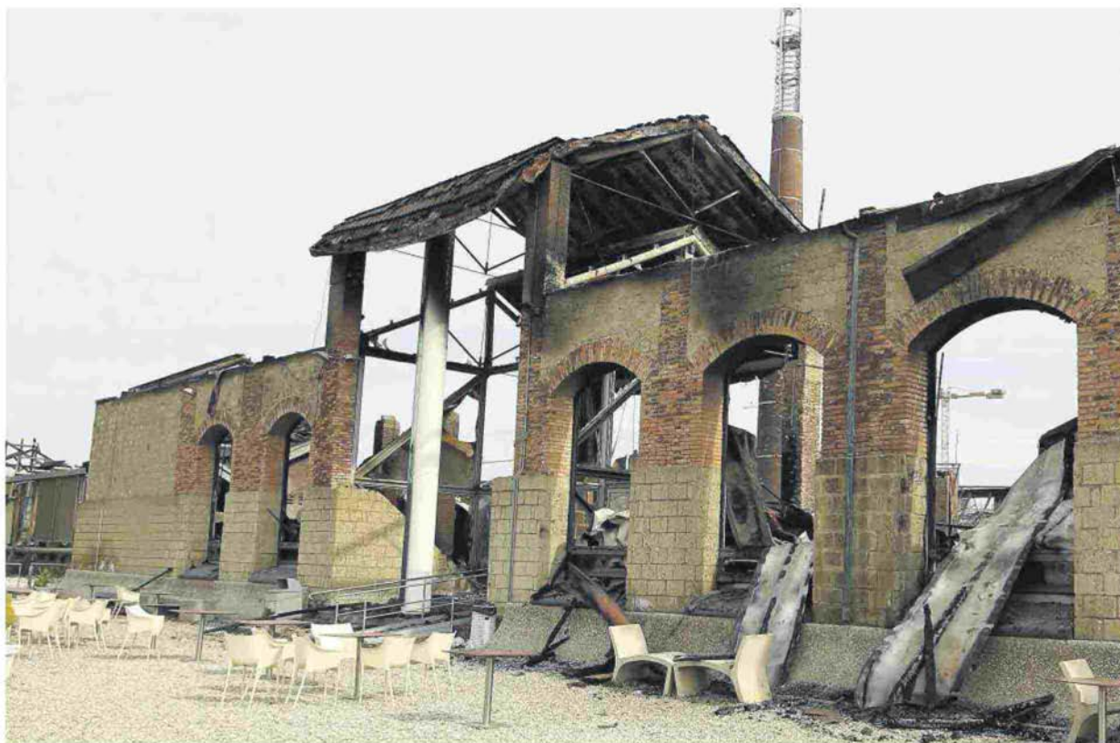
La Città della scienza distrutta da un incendio