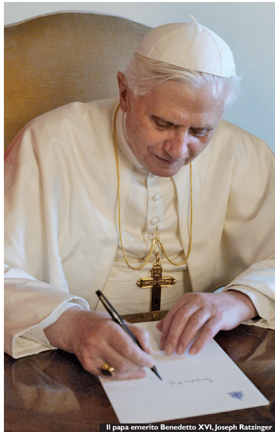
Il papa emerito Benedetto XVI, Joseph Ratzinger

F unzione importante della teologia è del resto quella di «mantenere la religione legata alla ragione e la ragione alla religione», ossia a quella razionalità del pensiero a cui costantemente fanno riferimento gli stessi scienziati atei. Inoltre, la «fantascienza esiste nell'ambito di molte scienze», come nel caso ad esempio di certe «visioni» di fisici quantistici come Heisenberg e Schrödinger o di certe tesi indimostrabili quali il «gene egoista» dell'evoluzionista Richard Dawkins; tuttavia si tratta «soltanto di immaginazioni con cui cerchiamo di avvicinarci alla realtà». Secondo Benedetto XVI, fino a questo punto le contestazioni di Odifreddi si mantengono a uno stadio di serietà accettabile per un dialogo tra credenti e non credenti; il livello degrada però repentinamente quando il matematico ateo affronta i te-