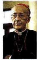
Camillo Ruini È stato presidente della Conferenza episcopale italiana dal 1991 al 2007