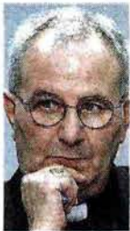
Gianpaolo Crepaldi Per il vescovo di Trieste «La Cei deve aggiornare le priorità»