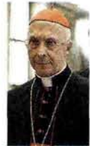
Angelo Bagnasco Nel 2007 Ratzinger lo ha nominato presidente della Cei dopo Ruini