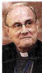
Domenico Mogavero Vescovo di Mazara del Vallo: «I laici facciano le loro scelte»