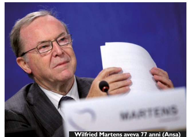
Wilfried Martens aveva 77 anni

su posizioni euroscettiche, fanno parte anche i turchi di Erdogan e il partito del discusso premier ungherese Viktor Orban. Martens se n'è andato prima di dover mettere mano a una possibile, nuova questione spinosa riguardante l'Italia. Ovvero la nuova trasformazione del Pdl in Forza Italia, con tutte le problematiche europee del caso (eventuale scissione compresa). L'Italia ha creato non poche gatte da pelare al presidente del Ppe. Con la fine della Dc e la nascita di formazioni minori e in concorrenza fra loro: Ccd, Ppi, Cdu, Udeur. Poi con il sofferto ingresso di Forza Italia. Ancora, con la