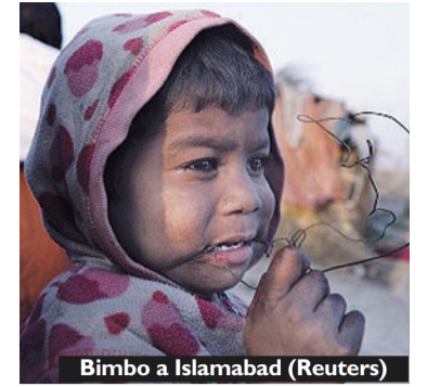
Bimbo a Islamabad

- vale a dire con meno di 307 euro al mese - una cifra doppia rispetto all'inizio della crisi, nel 2008. Il dato allarmante è contenuto nel rapporto della Caritas spagnola del 2012, anno in cui la organizzazione cattolica ha accolto e assistito in Spagna quasi un milione e 400mila persone. Il rapporto dell'Osservatorio sulla realtà sociale, presentato ieri a Madrid dal segretario generale della Caritas, Sebastian Mora, rileva «una situazione di abbandono, ingiustizia e spoliazione dei diritti più basilari delle persone». La Caritas spagnola nel 2012 ha investito 276 milioni di euro a scopi assistenziali, circa 25,5 milioni in più che nel 2011.