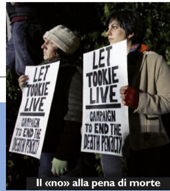
Il «no» alla pena di morte

Allarme di Banca mondiale sulle situazioni di estrema indigenza. Anche per Caritas Spagna la situazione è grave