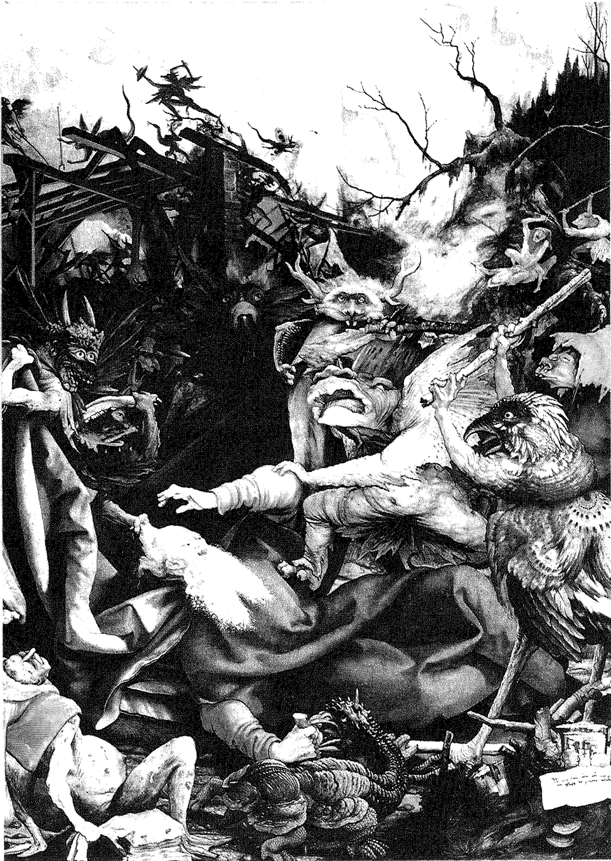
Le tentazioni di sant'Antonio, di Matthias Grünewald, anta della pala dell'altare di Isenheim, a Colmar