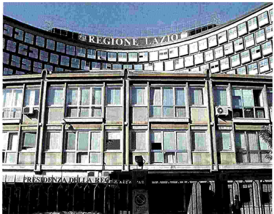
La giunta regionale darà oggi il via libera alle linee guida sull'eterologa