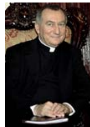
Il cambio A sinistra il segretario di Stato Tarcisio Bertone e qui accanto il suo successore più accreditato: l'attuale nunzio in Venezuela, arcivescovo Pietro Parolin