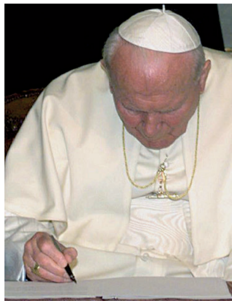
Il beato Giovanni Paolo II e, a destra, uno scorcio dell'aula di Montecitorio durante l'elezione del presidente della Repubblica

Pubblichiamo la lettera che il presidente del Movimento per la vita italiano, l'eurodeputato Carlo Casini, ha inviato, in data 8 maggio, a tutti i parlamentari italiani e a tutti i membri del governo.