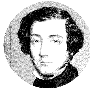
UNA PER TUTTI La classica rappresentazione della Giustizia, con spada e bilancia. Nei toni a sinistra, in alto Gustavo Zagrebelsky e in basso Alexis de Tocqueville