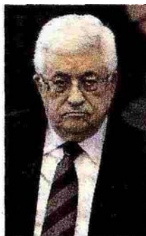
ABU MAZEN Il presidente palestinese chiede a Israele di "fermare immediatamente la sua escalation e i raid a Gaza" e vorrebbe l'intervento diplomatico internazionale