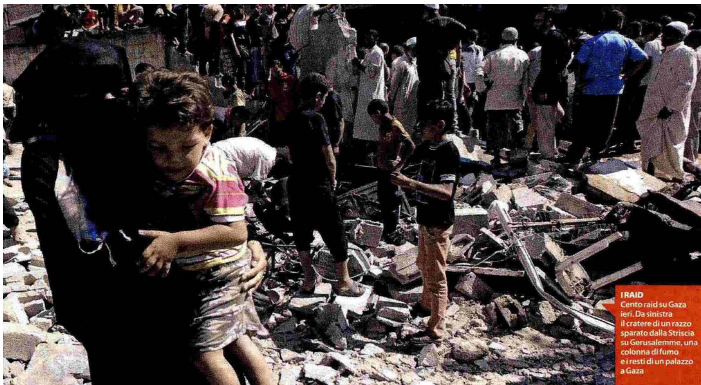
I RAID Cento raid su Gaza ieri. Da sinistra il cratere di un razzo sparato dalla Striscia su Gerusalemme, una colonna di fumo e i resti di un palazzo a Gaza