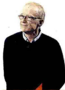
IL DISCORSO Pubblichiamo il discorso che lo scrittore israeliano David Grossman ha tenuto ieri al Forum per la pace organizzato da "Haaretz"