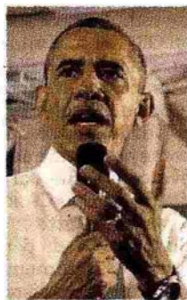
BARACK OBAMA In un editoriale su "Haaretz" Obama scrive: "Tutte le parti devono proteggere gli innocenti e agire con ragionevolezza e moderazione, non con senso di vendetta"