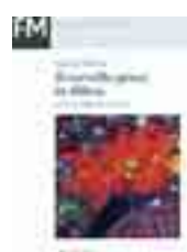
Il cervello gioca in difesa Gianvito Martino Ed. Mondadori 208 Pagine 15 euro

L'incontro tra uno spermatozoo e un uovo dà vita allo zigote; questa è la prima cellula del nuo-