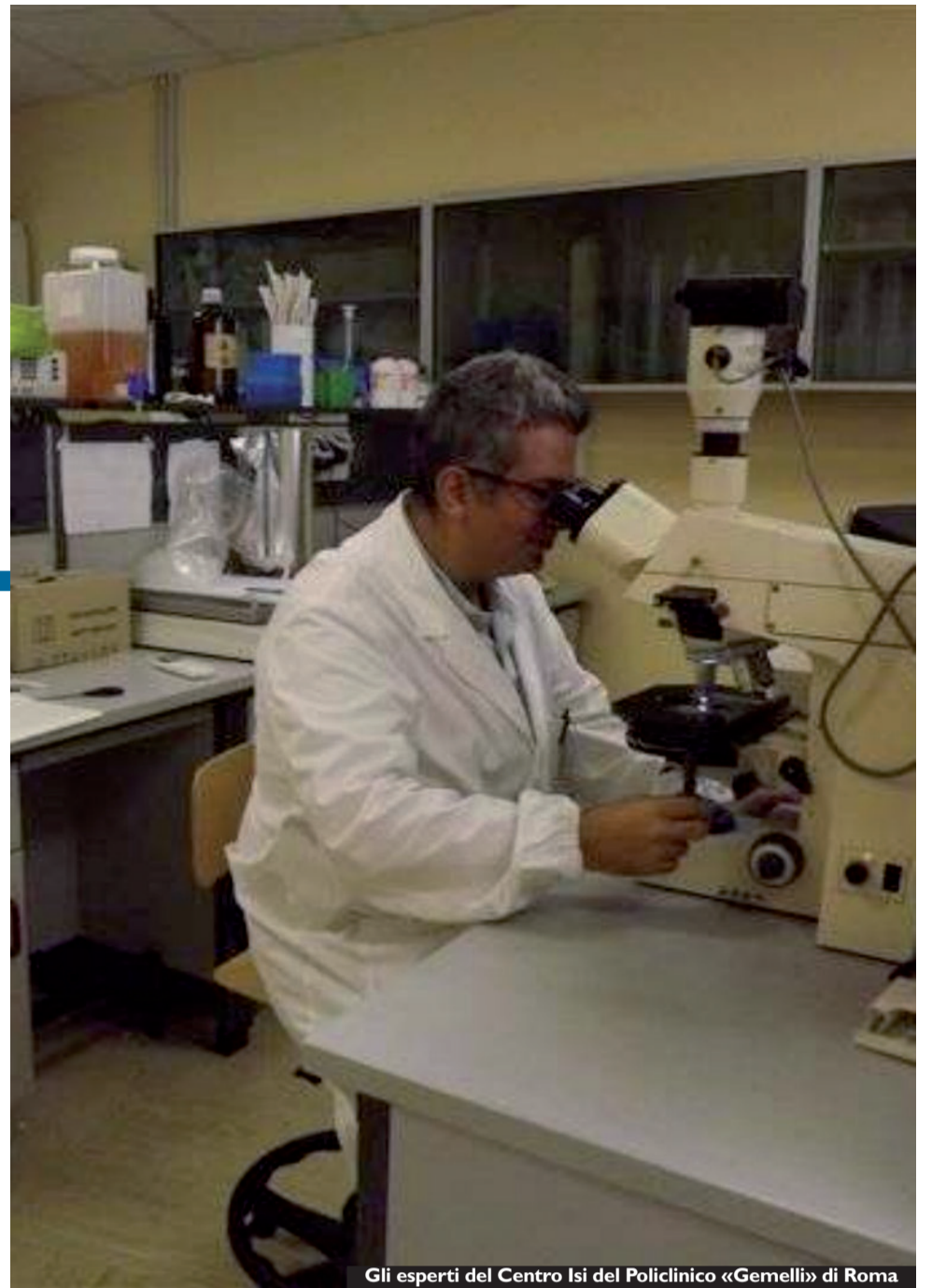
Gli esperti del Centro Isi del Policlinico «Gemelli» di Roma